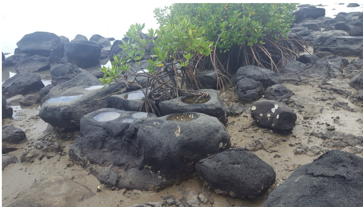
Ni isi o ata vaaia o se faaputuga o maa foaga olo'o maua faatasi i le Fagapalapala, Tuana'i