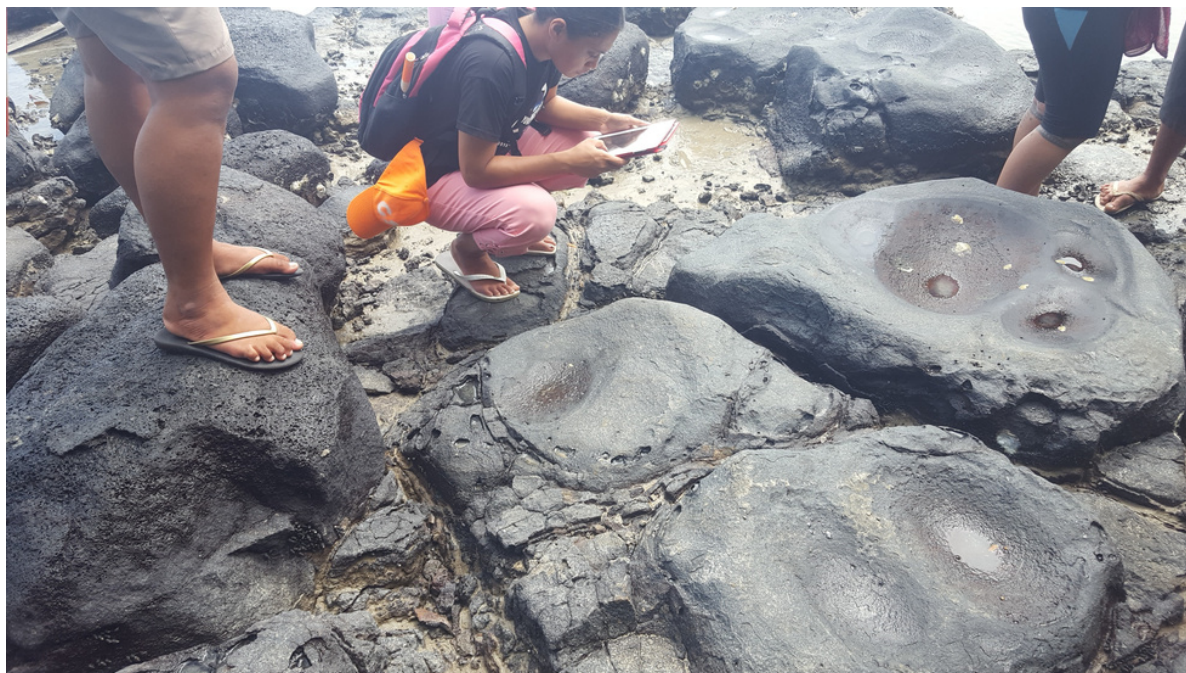
Saleaumua Vili oloo ia faamauina le foaga 1 sa mauaina