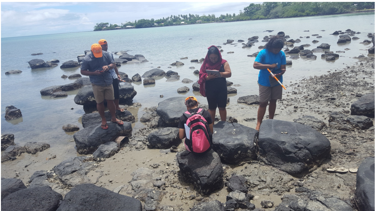
Itu i matu o le Fagapalapala oloo faamauina ma galulue ai le vaega suesue e faamauina ni isi o foaga oloo mauaina mai ai