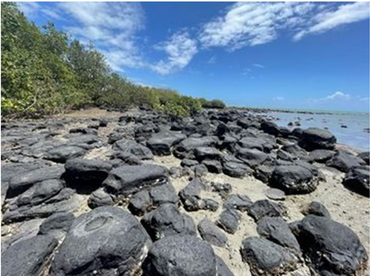
Itu Sasae o le matafaga, Tuana'i, Upolu

Sa faailoa mai foi e suli o lenei aiga, oloo tele ni isi o maa foaga oloo taatitia i gatai o le sami peitai e lei mafai ona matou sopolia ona o tulaga o le tai. Talitonu lenei Afioga oloo iai ni isi o foaga e tele matou te lei faamaumuina. Ma olea toe asia lenei Afioga i se taimi o lumana'i ina ia faamaumuina uma mai ma sailiili uma nisi foaga oloo iai.